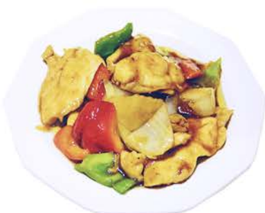
73 POLLO CON SALSA SACHA