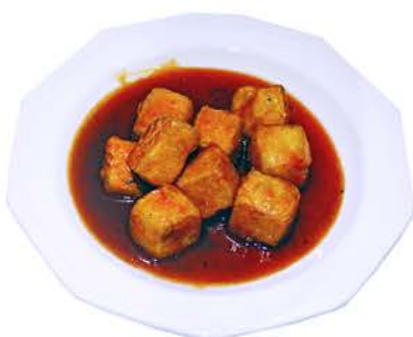
92 TOFU CON SALSA JAPONESA