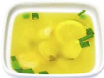
2 SOPA DE MARISCOS Calamar, Gambas y Almejas