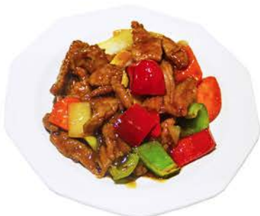
68 TERNERA CON SALSA DE OSTRAS