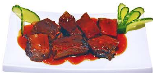
88 COSTILLAS CON SALSA