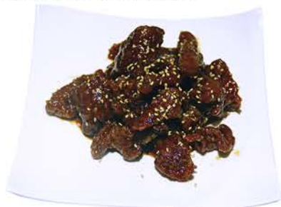
65 TERNERA CRUJIENTE CON SALSA JAPONESA