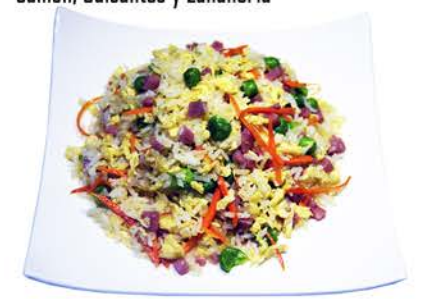
53 ARROZ TRES DELICIAS Jamón, Guisantes y Zanahoria