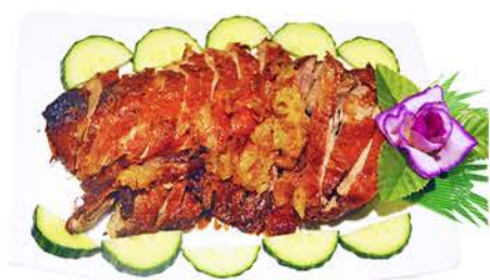
83 PATO FRITO CON SALSA