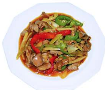
89 LOMO DE CERDO AGRIPICANTE