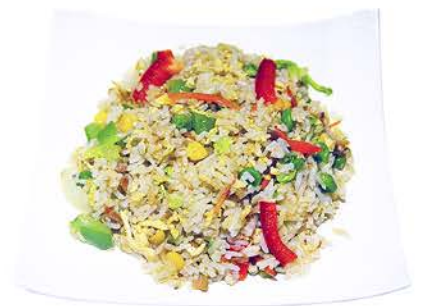
43 ARROZ CON VERDURAS Y HUEVO