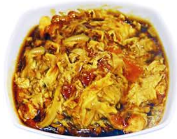
46 KATSUDON Huevos revueltos con Cerdo, Cebolla y Arroz