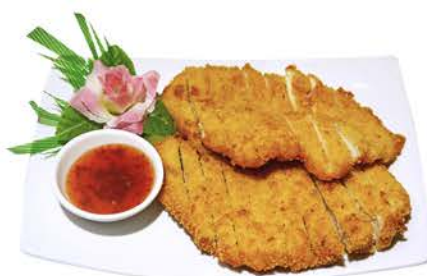
74 POLLO EMPANADO CON SALSA