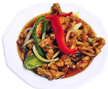
81 TIRAS DE POLLO AGRIPICANTE