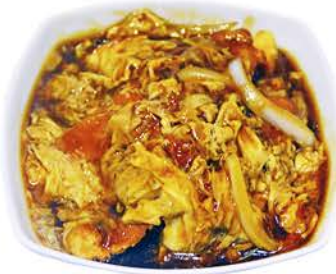
45 OYAKODON Huevos revueltos con Pollo, Cebolla y Arroz