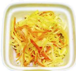
5 ENSALADA DE COL Zanahoria y Algas