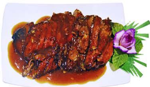
84 PATO CON SALSA DE LA CASA