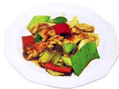
79 POLLO CON PUERRO