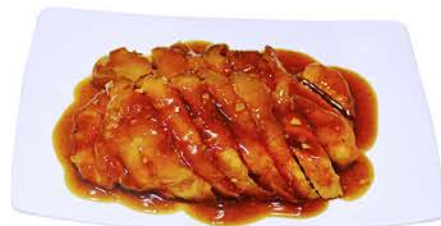
72 POLLO CON SALSA DE AJO