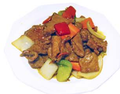
67 TERNERA CON SALSA CURRY