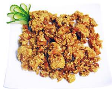
76 POLLO FRITO CON SÉSAMO Y SALSA