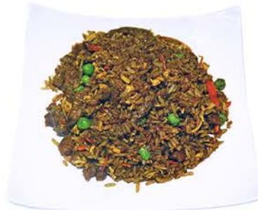
98 ARROZ CON TERNERA Y SOJA