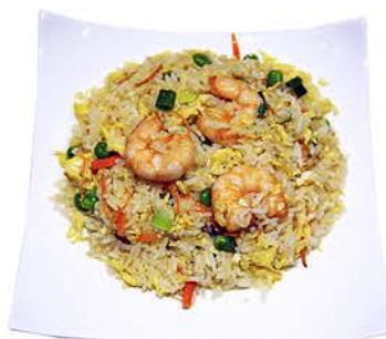
42 ARROZ CON GAMBAS