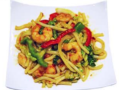
49 UDON Udon frito con Gambas