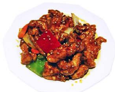
100 POLLO DE LA CASA