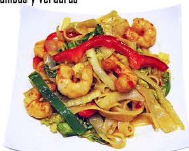
50 PASTA DE ARROZ Gambas y Verduras