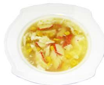
105 SOPA DE MAIZ CON CANGREJO