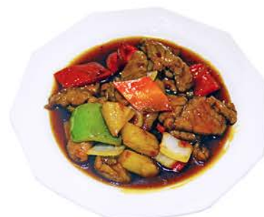
75 TERNERA DE LA CASA