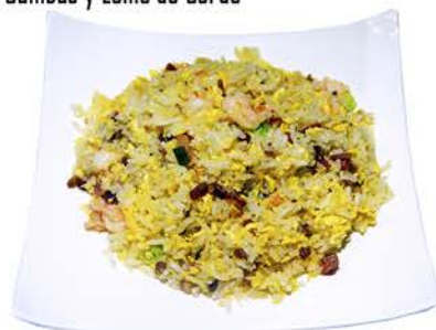
44 ARROZ DE LA CASA Gambas y Lomo de Cerdo