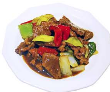
69 TERNERA CON SALSA SACHA