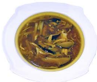
106 SOPA DE BAMBÚ Y SETAS Bambú, Setas y Gambas