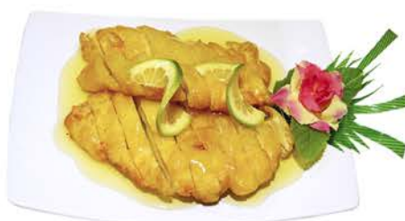
78 POLLO CON LIMÓN