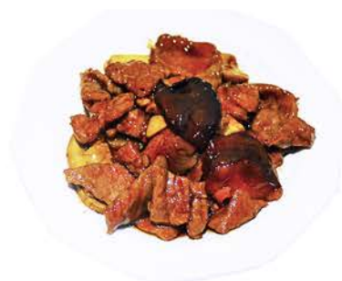
62 TERNERA CON BAMBÚ Y SETAS