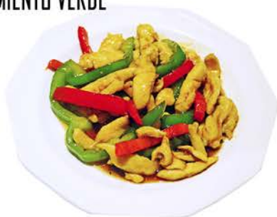
113 TIRAS DE POLLO CON PIMIENTO VERDE