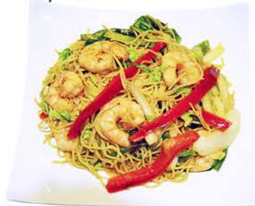
48 FIDEOS Gambas y Verduras