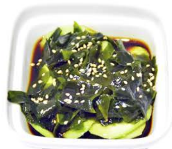
6 ENSALADA DE ALGAS Y PEPINO ALIÑADO