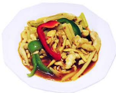
80 POLLO THAILANÉS