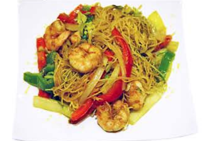
47 MIFU CON CURRY Gambas y Verduras