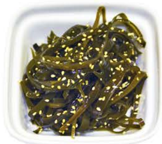
4 ENSALADA DE ALGAS