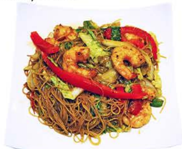
99 MIFU CON SOJA Gambas y Verduras