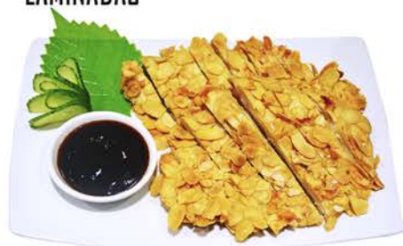
94 POLLO CON ALMENDRAS LAMINADAS