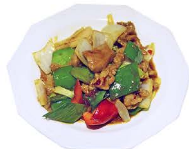
90 LOMO DE CERDO CON VERDURAS