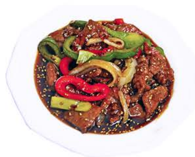
64 TERNERA CON SALSA JAPONESA