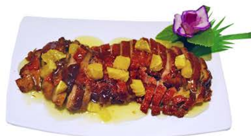
115 PATO A LA NARANJA