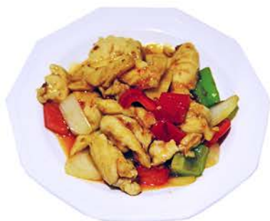
112 POLLO CON SALSA PICANTE