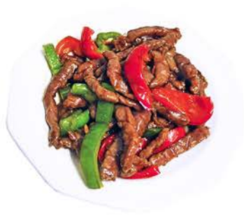
63 TERNERA CON PIMIENTO