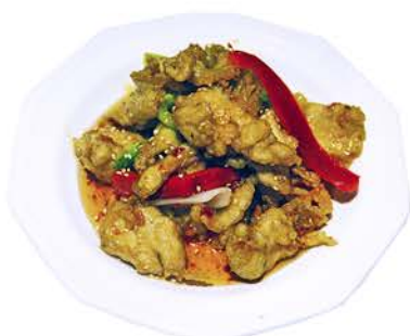
70 POLLO AGRIPICANTE