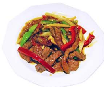
66 TERNERA PICANTE