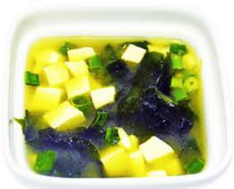
1 SOPA DE MISO Tofu y Algas