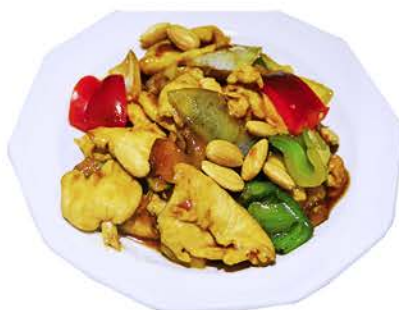
71 POLLO CON ALMENDRAS