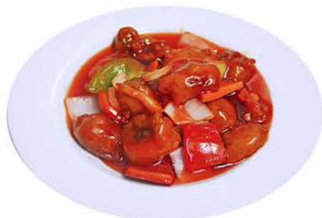
85 CERDO AGRIDULCE