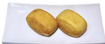
24 MINI PAN Pedir por Unidad