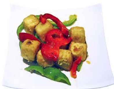
93 TOFU CON PIMIENTA Y SAL