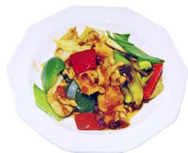
77 POLLO GONGBAO