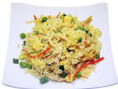
41 ARROZ CON POLLO