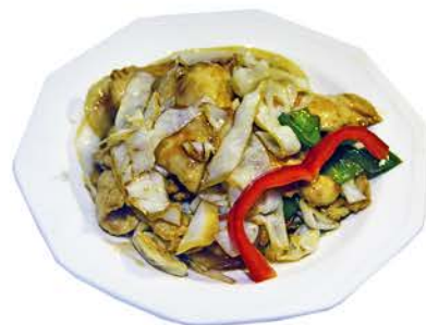
114 CHOP SUEY DE POLLO