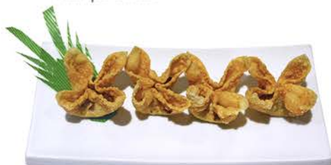
23 WANTUN FRITO Pedir por Unidad