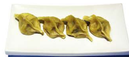
22 EMPANADILLA DE CARNE Gyoza Pedir por Unidad