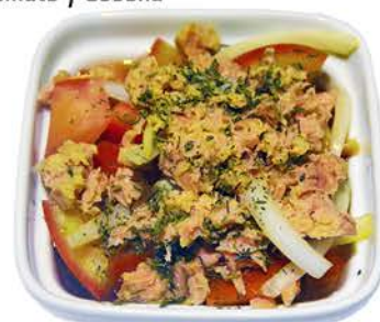
3 ENSALADA DE TOMATE Tomate y Cebolla