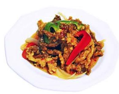
82 TIRAS DE POLLO Y TERNERA